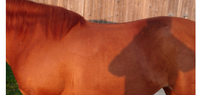
Detailfoto von der Rückenlinie, seitlich, gerader Untergrund Neutrale Kopfhöhe