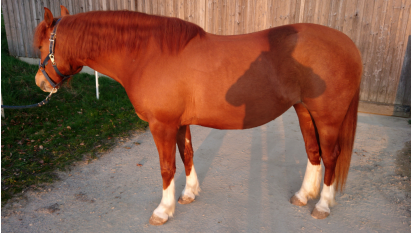
Foto vom ganzen Pferd, seitlich, gerader Untergrund Neutrale Kopfhöhe

Folgende Bilder benötigen wir für eine Beurteilung der Passform: