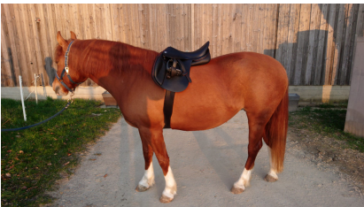
Foto vom ganzen Pferd, seitlich, gerader Untergrund Neutrale Kopfhöhe Sattel ohne Unterlage, gegurtet