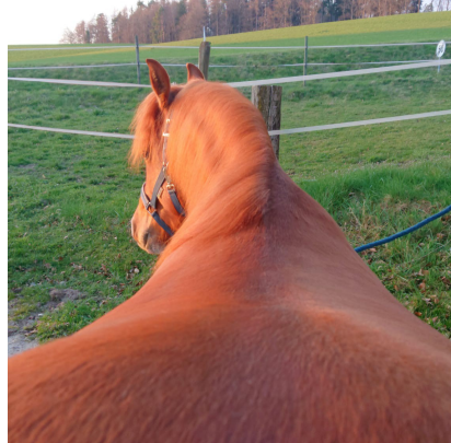
Foto von hinten auf den Widerrist, wenn möglich von leicht erhöht